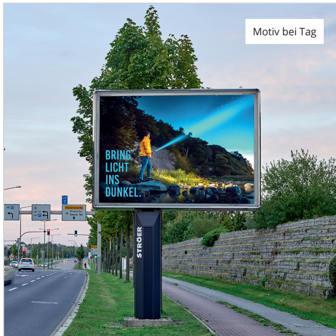
Motiv bei Tag